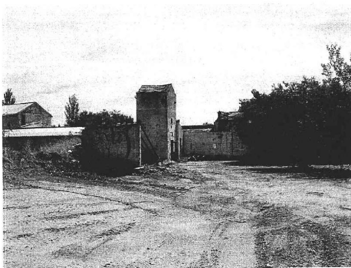
Vista de las construcciones abandonadas de uso agrícola en el extremo sureste de la UE-2A

En el resto de los años analizados en el documento original estas construcciones siguen teniendo un uso agrícola, aunque en la actualidad se encuentra en estado de abandono como se puede observar en la imagen mostrada a continuación.