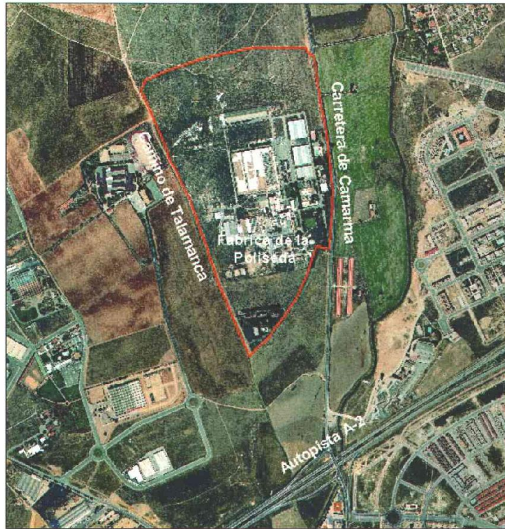
Figura 3.2. Foto aérea del ámbito de estudio dentro del Término Municipal de Alcalá de Henares

El ámbito de estudio se encuentra limitado al Norte por la parte del Anillo colector, Sistema General Viario SGVI-Q, al Sur por el Sector 28-C de uso mixto, terciario comercial hotelero. Por el Este el ámbito limita con la carretera M-119 que lo separa del Pasillo Verde del Arroyo de Camarmilla, y al Oeste con la vía pecuaria del Cordel de Talamanca. Es importante destacar que, si bien a nivel de Modificación Puntual se prevé la existencia de un vial en la zona norte del ámbito, no están definidos aún ni el trazado ni la sección del viario definitivos del denominado Anillo colector norte del Sistema General SGVI-Q.