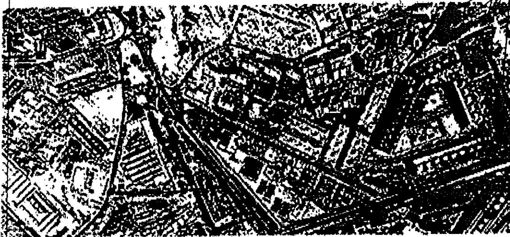
FOTOGRAFIA AEREA DE LA UNIDAD

Excmo. Ayuntamiento de Alcalá de Henares APROBADO INICIALMENTE EN JUNTA DE GOBIERNO LOCAL 03 de ABR 2007 de 20..... EL TITULAR DEL ORGANISMO DE ALCALÁ DE HENARES